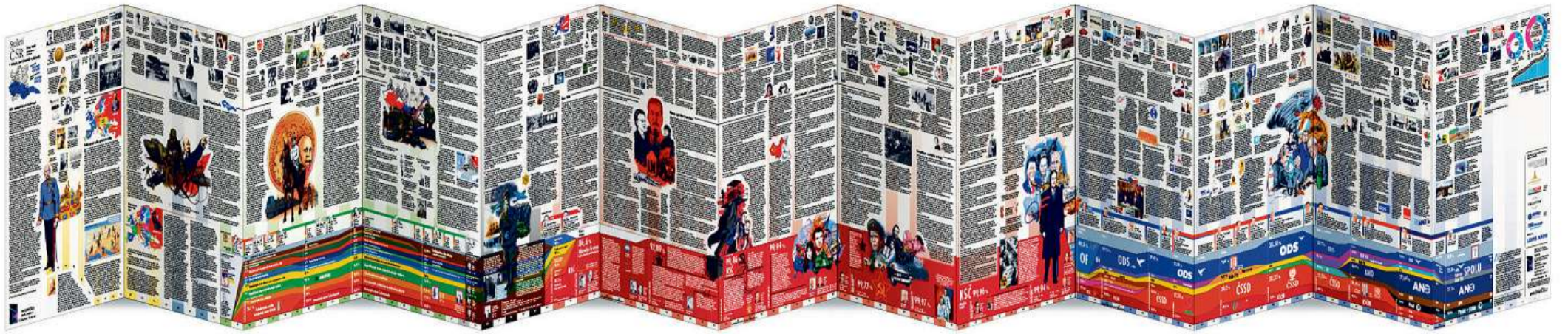
Kniha jako rozložené leporelo názorně ukazující příběh republiky má na délku více než čtyři metry. Graf přibližuje výsledky voleb, premiéry a vládnoucí koalice za celou historii státu. Krásné ilustrace kreslíře Richarda Cortése vyprávějí dějinné zvraty České republiky samy o sobě. FOTO WWW.STOLETICSR.CZ, ILLUSTRACE RICHARD CORTÉS